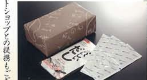
おいしいだし 2,100円～ 脳が働く調味料として旨い事はもちろん、そのまま健康スープとしてもおいしいです。