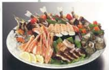
オードブル（仕出用・一皿5人前） 10,500円～