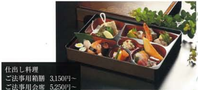
仕出し料理 ご法事用箱膳 3,150円～ ご法事用会席 5,250円～