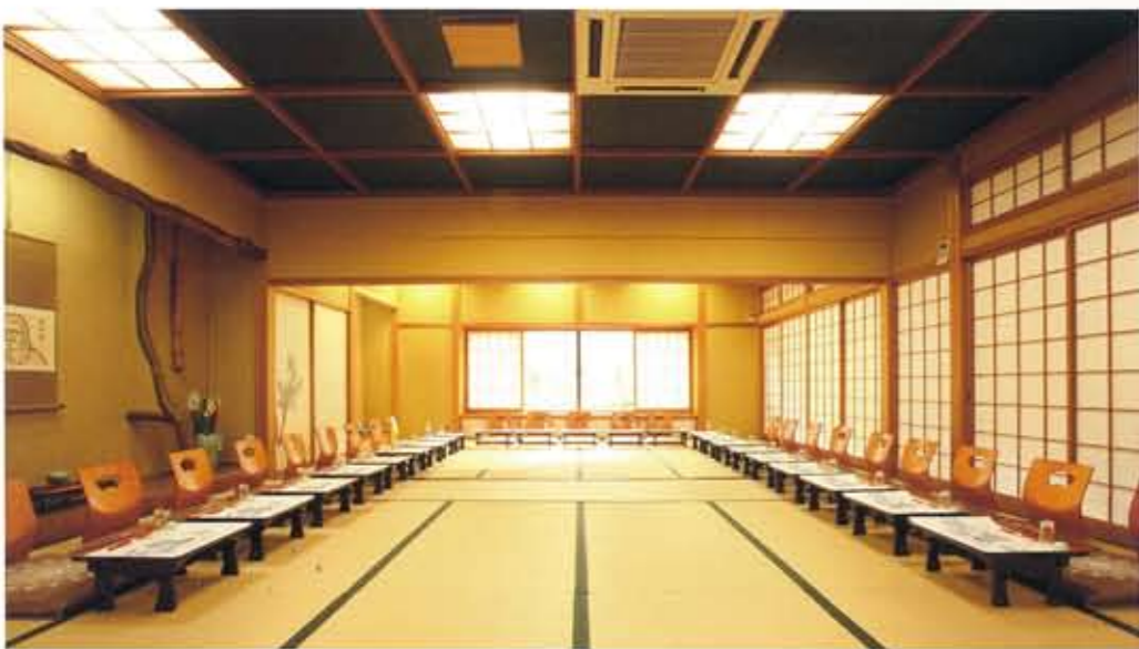
大広間 御膳利用で最大45名様までご利用いただけます。また、座卓（低いテーブル）でのご用意も可能です。