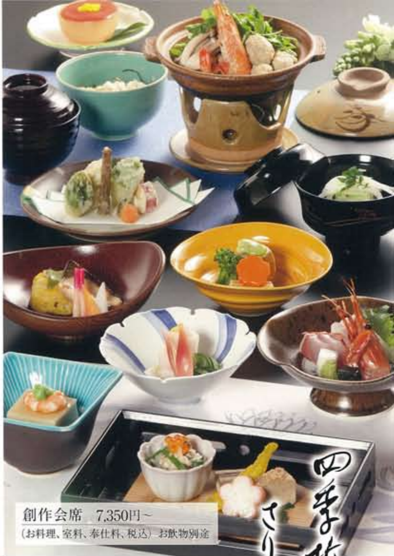
創作会席 7,350円～ (お料理、室料、奉仕料、税込) お飲物別達

日本海の新鮮な魚・無農薬の元気な野菜をふんだんに、こだわりの調味料を使用し、一品一品おもてなしの心を込めて丁寧にお作りしております。明るくて静かな雰囲気、場にふさわしい室礼、遠方からおいでのご親族もほっとなさることでしょう。