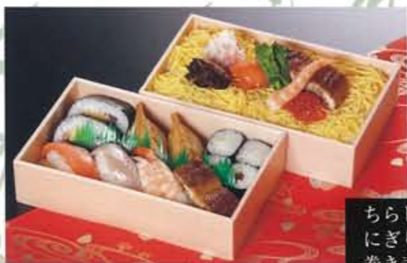
ちらし寿司 1,050円 にぎり10巻 1,575円 巻き寿司 1,260円