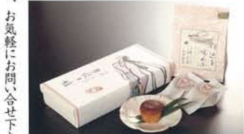
小田温泉オリジナル 多伎々姫 10ヶ入 1,680円 5ヶ入 840円 いちじくのおいしいお菓子