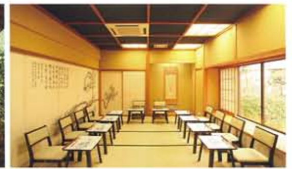
高座椅子（10名様程度）椅子形式の御膳です。お膳が楽なお席です。