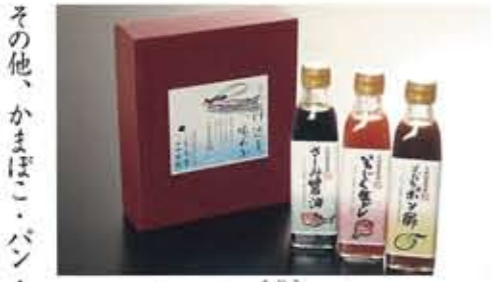
小田温泉の味 味美3本セット いちじく生ドレ・すだちポン酢・さしみ醤油 各300ml 2,625円