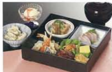
お子様弁当 2,100円 お子様ランチ（プレート）1,050円もございます