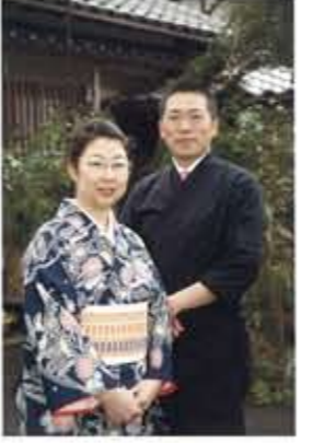
たいせつなお席、心をこめておもてなしさせていただきます。